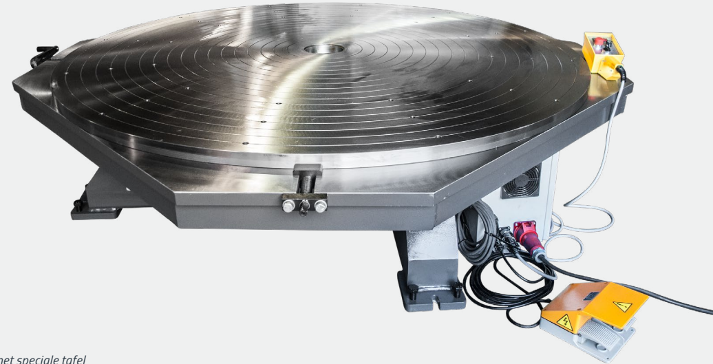
D-TT-15 met speciale tafel